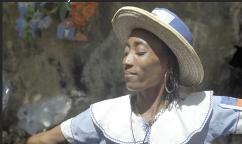
Doc. / France, Haïti / 80' / 2024 / Corpus Films, Bleu et Rouge Prod.

Les "bossales" étaient les esclaves africains vainqueurs de la guerre d'indépendance d'Haïti. Ce terme qualifie désormais une personne rebelle, à l'image des protagonistes du film. Dans un contexte social explosif, ils incarnent l'âme de ce pays, foyer incandescent de résistance politique et spirituelle.