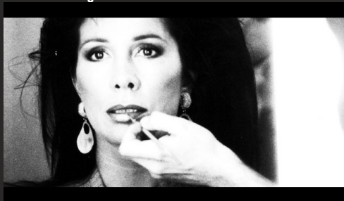
Doc. / Allemagne / 106' / 1983 / Journal-Film Klaus Volkenborn KG