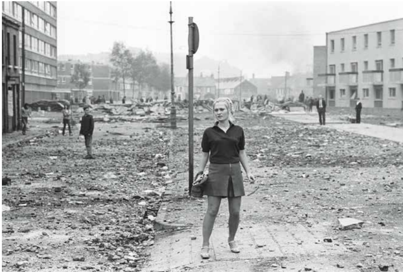
Émeutes du Bogside. Août 1969, Irlande du nord, Ulster, Londonderry