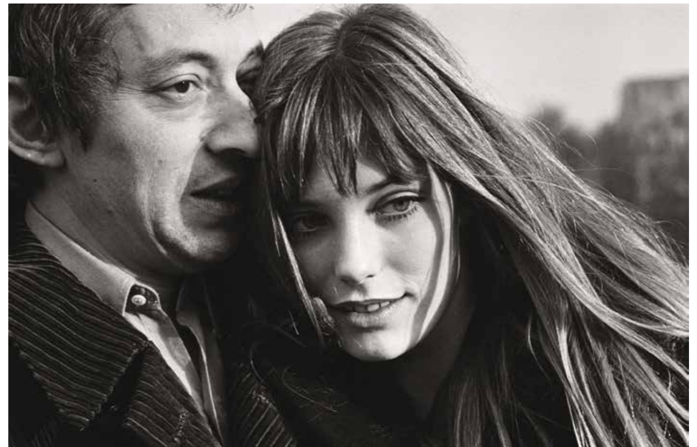
Jane Birkin et Serge Gainsbourg sur le tournage du film Les Chemins de Katmandou de André Cayatte