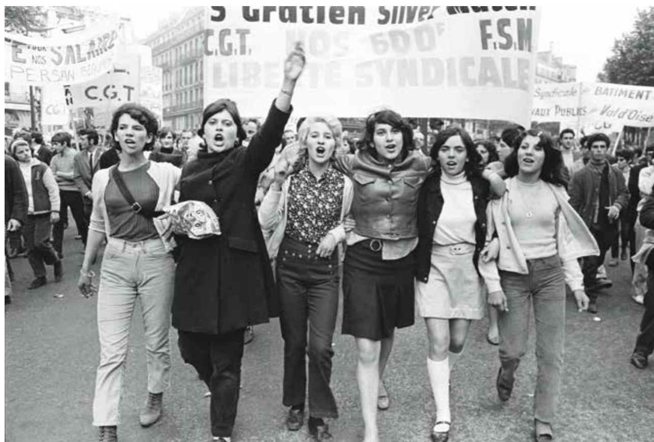
Manifestation CGT. Mai 1968