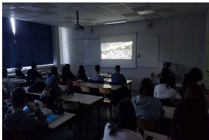
Lycée Bellevue, Saintes - Das Spiel