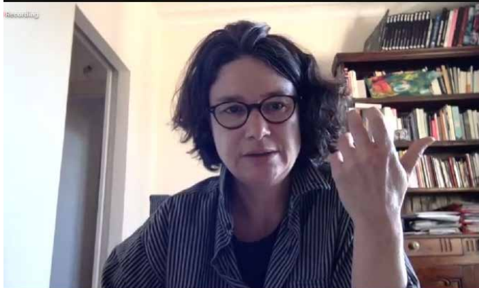
Table ronde «Quels impacts de la crise sanitaire sur le travail des auteurs.trices/réalisateurs.trices de documentaires ?»

Mise en page Thomas Dupuis - éditions Flibl, Julien Grimaud · Équipe du festival Maïté Peltier, Murielle Scalzo, Isabelle Taveneau, Maëlis Gueguen, Julien Grimaud, Lucille Griffon, Héloïse Nonat · Le journal Traversez la rue est la concrétisation d'un atelier critique mené par Filmer le travail depuis novembre 2020 avec un groupe d'étudiants de l'Université de Poitiers, issus du master Cinéma et Théâtre Contemporains, du master LiMès et de Sciences Po Poitiers · Réalisation encadrée par Isabelle Taveneau