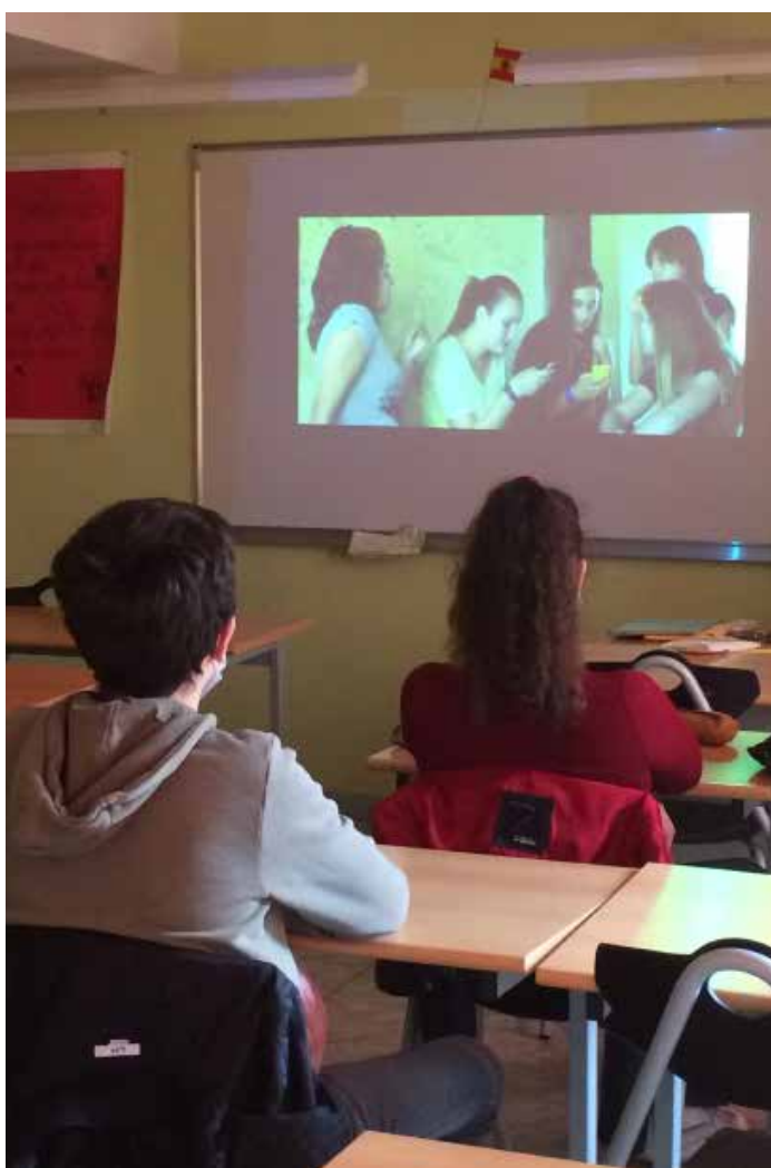
Lycée Aliénor d'Aquitaine, Poitiers - Adolescentes