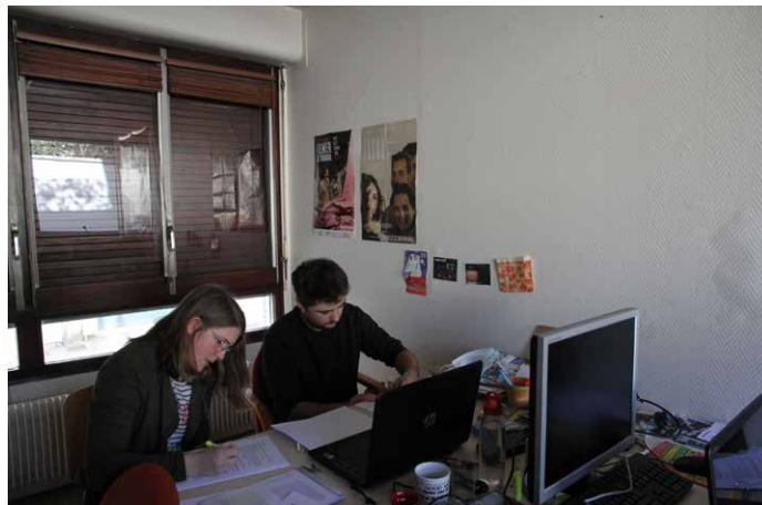
Table ronde «Étudier en temps de crise(s)»