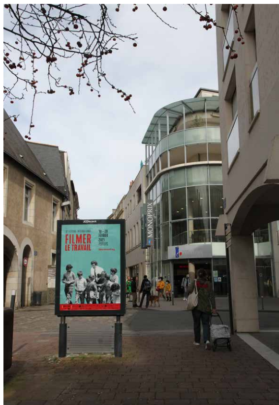
Entrée des Cordeliers