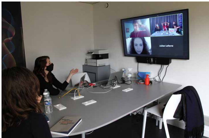
Rencontre «Silences d'exils»