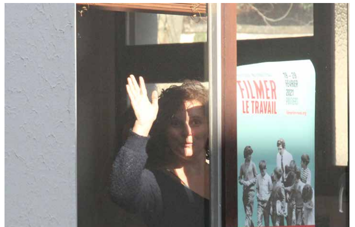
Salut les copains