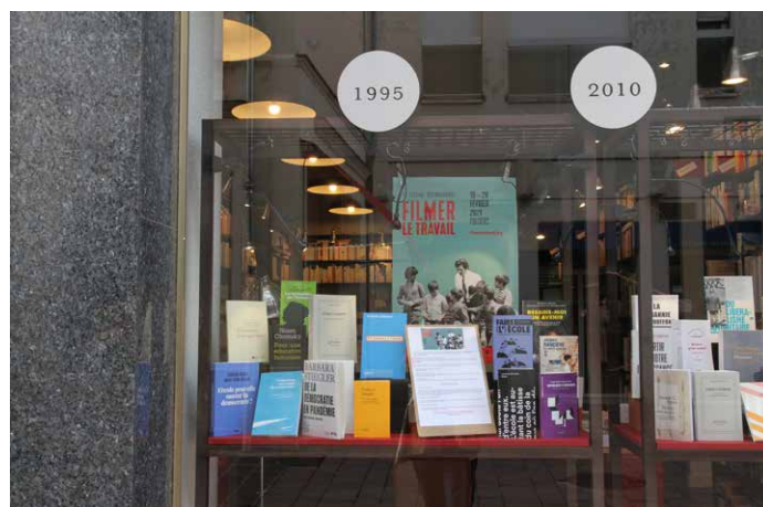
La Belle Aventure