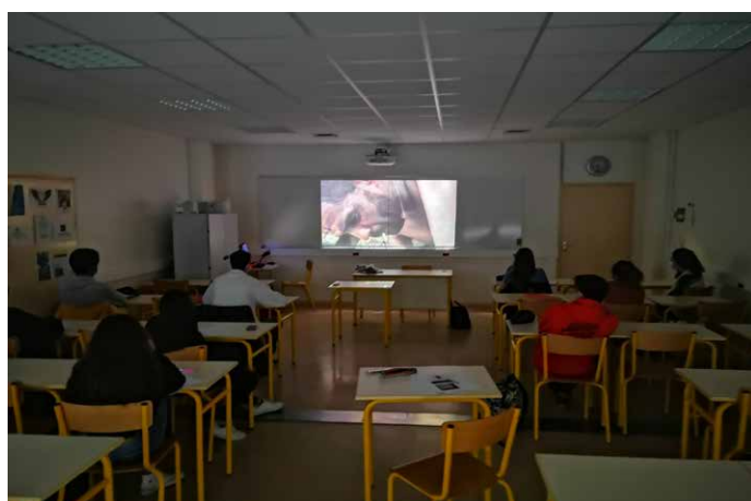
Lycée Jean Dautet, La Rochelle - Rio de Vozes