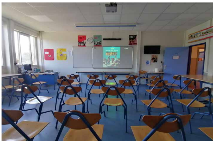
Collège Jean Moulin, Poitiers - Entre les murs