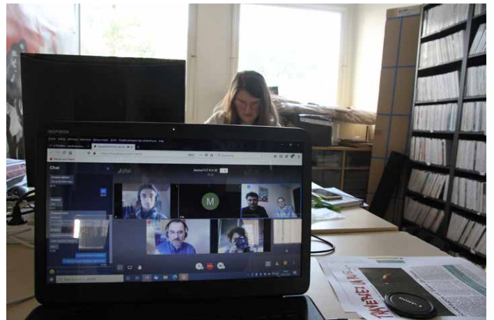
Les réunions de rédaction du journal