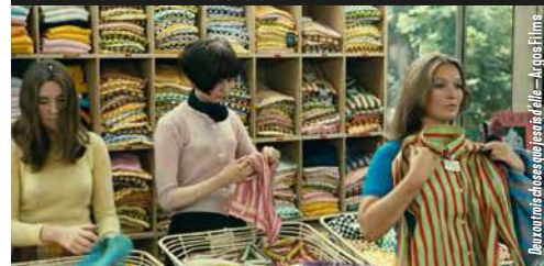
Deux ou trois choses que je sais d'elle

Jean-Luc Godard est un cinéaste qui compte pour nous. Lors des éditions précédentes, nous montrions Tout va bien , Vivre sa vie , France, tour, détour, deux enfants (co-réalisé avec Anne-Marie Miéville). Son attention portée à la question du travail, ses formes radicales et libres nourrissent notre regard et nous donnent à penser. Nous montrerons cette année le magnifique Deux ou trois choses que je sais d'elle le samedi 18 février à 20h30.