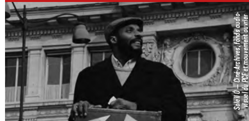
Soleil Ô - Dore Archives / Cédé audio / Vidéo / DVD / Embarquement surpier

À l'occasion du festival, trois films de cinéastes majeurs sénégalais et mauritanien sont à découvrir en copie restaurée. En présence de Federico Rossin, historien du cinéma et de Thierno Ibrahima Dia, historien et journaliste sénégalais :