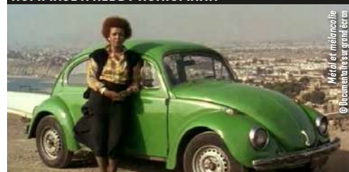
Métal et mélancolie - © Invention Vidéo / Vidéo / DVD

Cinéaste disparue en 2022, Heddy Honigmann force le respect par sa constance à porter son regard et sa caméra vers les plus faibles, musiciens marginaux des métros parisiens, immigré-e-s en quête de lieux habitables, chauffeurs de taxis à Lima. Un de ses plus beaux films sur le travail des rues, Métal et mélancolie , sera projeté le mercredi 22 février à 20h30.