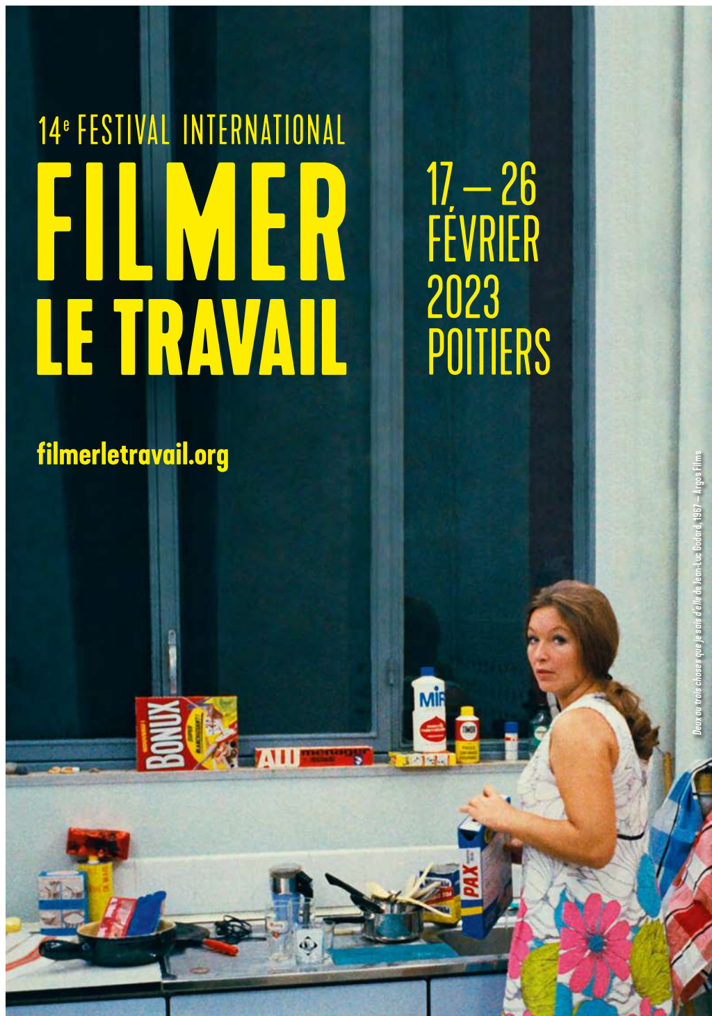
Deux ou trois choses que je sais d'elle de Jean-Luc Godard, 1987 - Argos Films